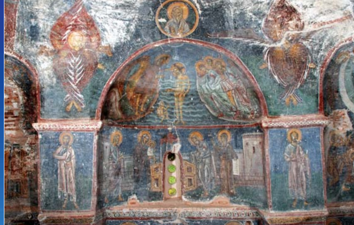
Τοιχογραφίες στο νότιο τοίχο του κυρίως ναού Southern wall of the main church

Ο ναός της Παναγίας της επονομαζόμενης «Κρήνας» , βρίσκεται στην αγροτική περιφέρεια του οικισμού των Βαβύλων στην κεντρική Χίο. Πρόκειται για ένα από τα σημαντικότερα μνημεία του νησιού, αλλά και της βυζαντινής αρχιτεκτονικής γενικότερα. Ακολουθεί τον αρχιτεκτονικό τύπο του Καθολικού της Νέας Μονής, ανήκει δηλαδή στους οκταγωνικούς ναούς. Η διαφορά με το πρότυπο βρίσκεται στην στήριξη του τρούλου προς τα ανατολικά, όπου εδώ στηρίζεται σε ψηλή καμάρα. Αποτελείται από τον κυρίως ναό και τον εσωνάρθηκα, φάσεις με μικρή χρονολογική διαφορά μεταξύ τους, που χρονολογούνται στον ύστερο 12ο αι. Η ύπαρξη δύο αρκοσολίων στη βόρεια και νότια πλευρά του εσωνάρθηκα αντίστοιχα, δηλώνει τη ταφική χρήση του τμήματος αυτού του ναού. Ο ερειπωμένος σήμερα εξωνάρθηκας, προστέθηκε πολύ αργότερα, κατά τον 16ο αι. Τμήμα του τρούλλου του κυρίως ναού, ο τρουλίσκος και ο δυτικός τοίχος του εσωνάρθηκα κατέπεσαν στο σεισμό του 1881 και ανακατασκευάστηκαν το 1884.