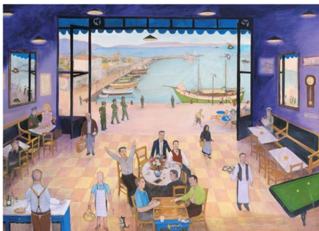
Το καφενείο του Φερεντίνου - 1944 Η αποχώρηση των Γερμανών 2007 130 x 180 εκ., acrylic on canvas