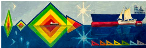
Το μεγάλο ψάρι τρώει το μικρό 2016, 21 x 61 εκ., acrylic on canvas

There have been solo exhibitions in New York, Paris, Athens, Chios and he has participated in many group exhibitions. His works are in private and public collections.