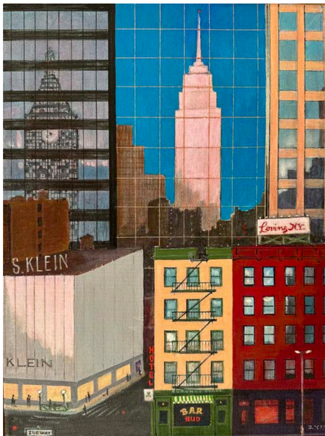
Loving New York 2008 45 x 34 εκ., acrylic on canvas